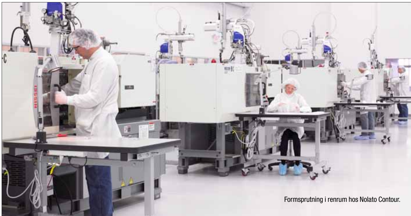
Formsprutning i renrum hos Nolato Contour.

pel behörighetskontroller i IT-system och attestkontroller.